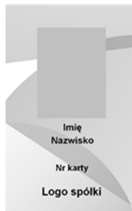
Karta dla pracownika Spółki