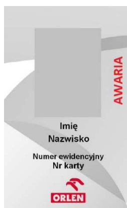
Karta dla pracownika ORLEN S.A